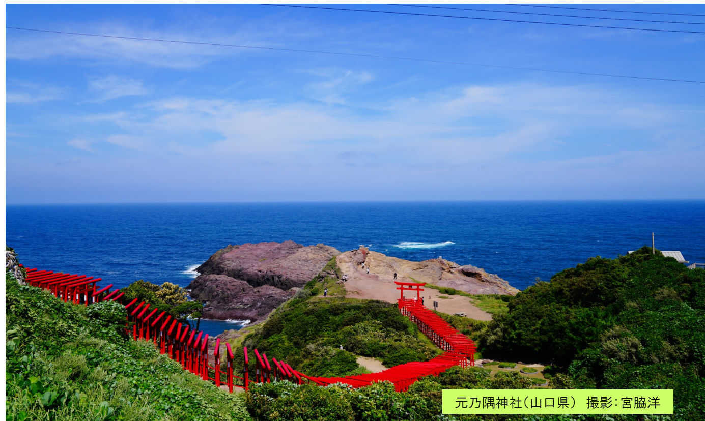
元乃隅神社(山口県)

第73号:2024年7月1日発行 発行者:老人保健施設 桃寿苑 / 発行責任者:今井 亮 住所:京都市伏見区向島津田町235-1 / TEL:075-612-3100